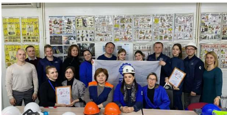
На фото: интеллектуальная игра, приуроченная ко Всемирному Дню охраны труда в ЦВЛ ЦОПК Блока закупок (ОППО ПАО "КАМАЗ")

ФНПР призвала свои членские организации провести информационно-разъяснительные мероприятия (выставки, круглые столы, форумы, конференции), организовать лекции, направленные на привлечение внимания общественности к проблемам в сфере охраны труда в коллективах и на предприятиях страны.