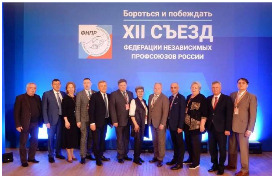
3 апреля в Москве в Доме Союзов открылся XII съезд ФНПР.

На Съезде прибыли более 600 делегатов, избранных членскими организациями на XII съезд, председатели профкомов первичных профсоюзных организаций, ветераны профсоюзного движения, руководители учебных заведений профсоюзов, молодежных советов и комиссий, а также руководители профсоюзов и профсоюзных объединений, сотрудничающих с ФНПР, представители национальных профцентров из 10 стран, представители Администрации Президента Российской Федерации, члены Правительства, Совета Федерации, депутаты Государственной Думы Федерального Собрания Российской Федерации, представители объединений работодателей, учреждений науки и культуры, социальные партнеры профсоюзов.