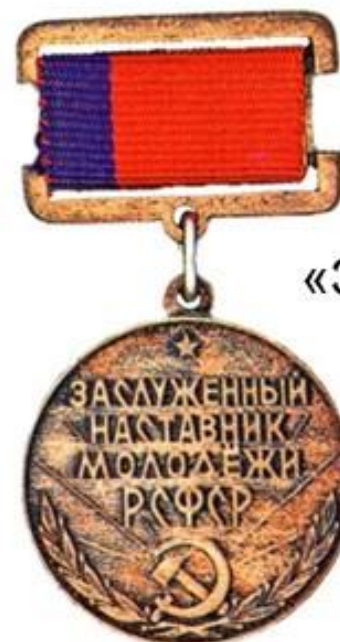
Звание «Заслуженный наставник молодежи РСФСР» (1981)