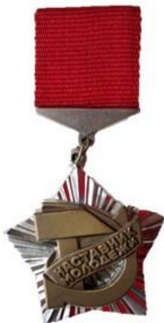
знак «Наставник молодежи» (1934)